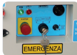
Pannello comandi a terra intuitivo e ben protetto dagli urti involontari.