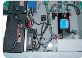
Montaggio della componentistica molto ordinato ed ergonomico per lo svolgimento della manutenzione.