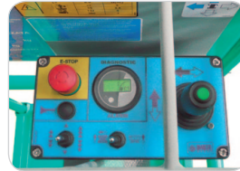
Scatola comandi IP65 semplice e intuitiva.