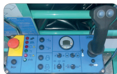
Quadro comandi sulla piattaforma semplice e intuitivo.