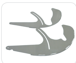
Kit protezione disco