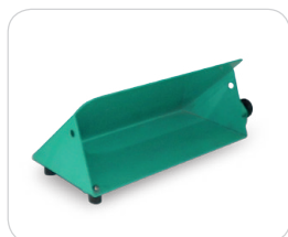
Supporto taglio 45°