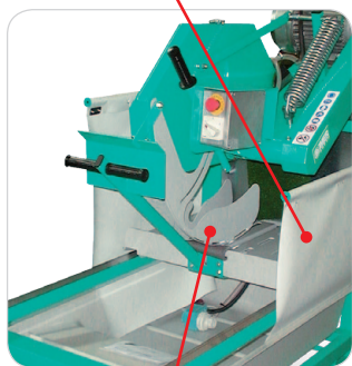
Protezioni laterali disco