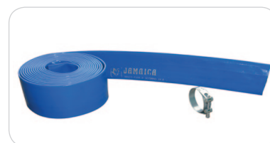
Manichetta di scarico L=10 m con fascetta