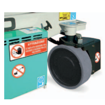
Sterzo idraulico a 90°