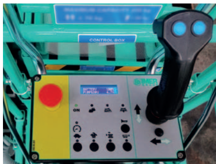
Quadro comandi sulla piattaforma con pulsanti capacitivi: semplicità e sicurezza di utilizzo