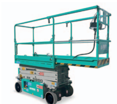
Estensione manuale piattaforma 1 m