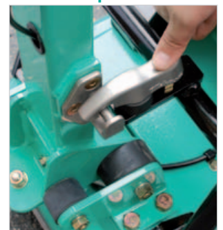
Posizione di minimo ingombro